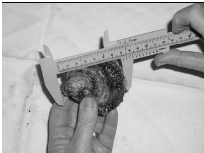
Slika 1. Mjerenje veličine kamenice, Ostrea edulis L.